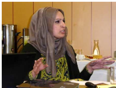
Travail sur la diversité et la place des femmes