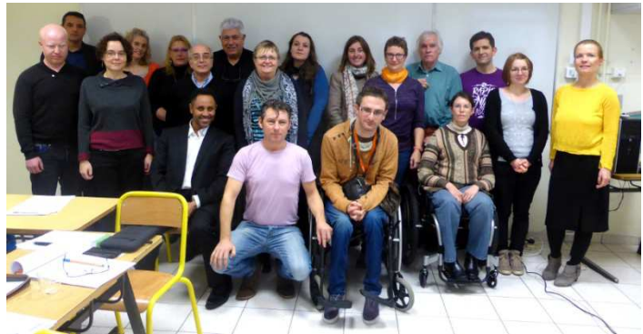
Une partie du groupe de stagiaires à Sillé