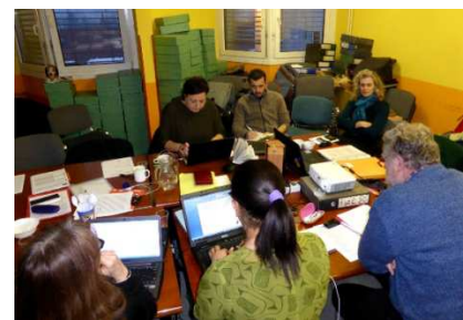
En groupe de travail à Radio Student