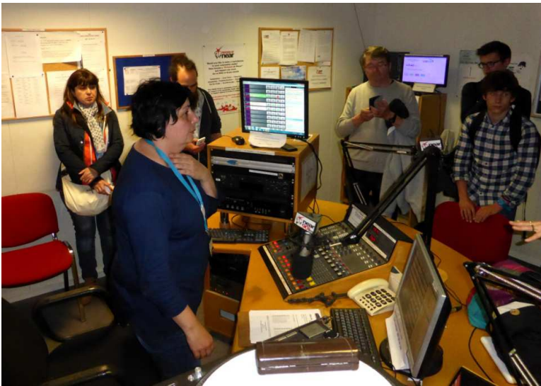
A Near FM

Lorsqu'un bénévole quitte une radio, avec quoi part-il ? Eventuellement des enregistrements de ce qu'il a pu faire, des éventuelles coupures de presse le montrant en action, des rapports de réunions évoquant son action, des messages d'auditeurs, des restes de visibilité sur un site internet..... Rien qui n'ait une valeur sérieuse pour l'insertion sociale ou pour accéder à un emploi, que ce soit dans le monde de l'information et de la communication, pour tout autre secteur ou encore plus, et paradoxalement, pour entrer dans une autre radio, d'autres formats, à proximité, à l'autre bout de son pays ou de l'Europe.