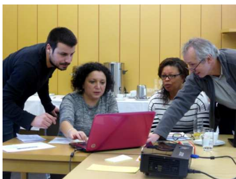
Produire des résultats