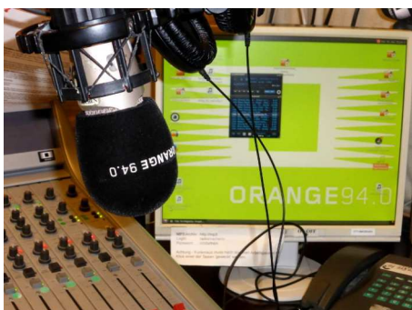
En Autriche à Vienne

Notre mission ne peut que se vouloir positive en ayant en tête ce que le bénéficiaire pourra en tirer avantage, par exemple, pour l'insertion sociale ou l'employabilité. Toute autre approche serait en absolue contradiction avec les valeurs portées par les radios associatives et communautaires.