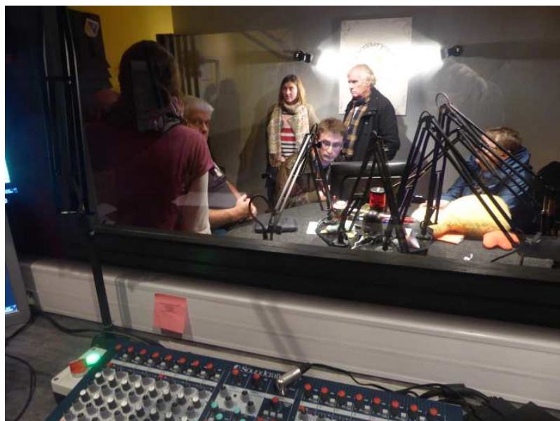
A Radio Ornithorynque