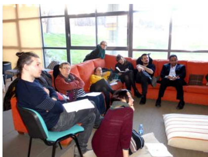
En réflexion sur l'évaluation