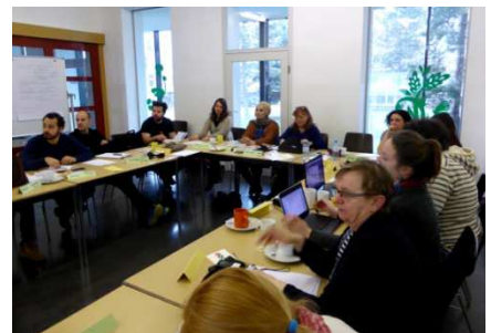
Réflexion sur l'évaluation