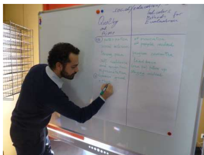
Restitution de groupe à Vienne