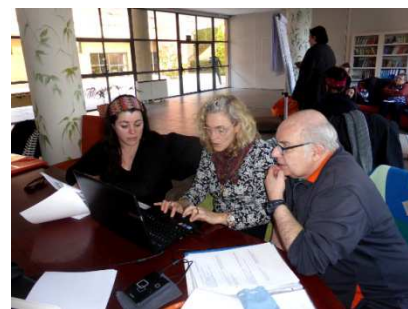
En atelier sur les questionnaires à Madrid