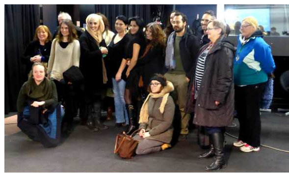
Le groupe sur le plateau de la télévision communautaire OKTO TV