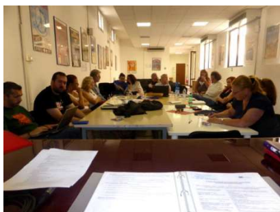
En plénière au siège d'ARCI NovaRadio