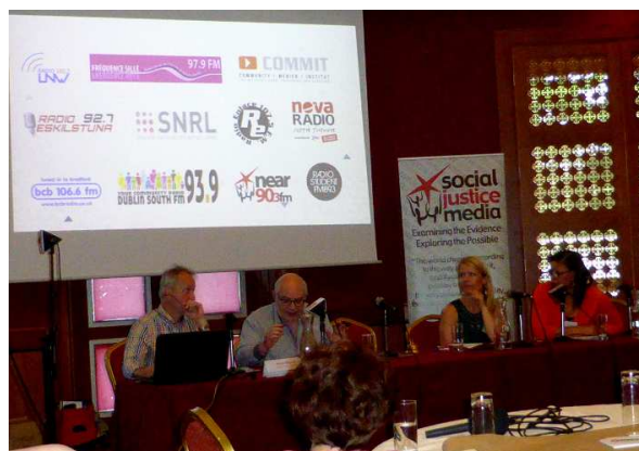
A Dublin, séminaire de dissémination