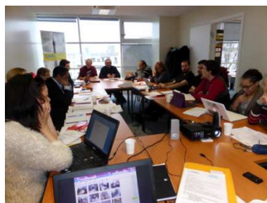
Au travail au siège du SNRL