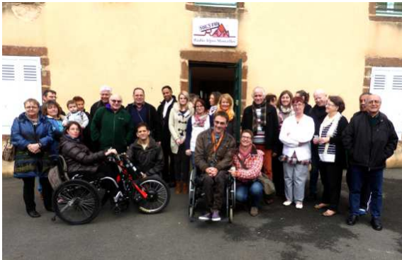
Radio Alpes Mancelles