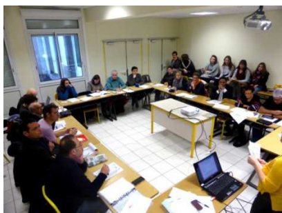
En plénière d'échanges de pratiques

L'action s'est terminée à Rennes, à l'Hôtel de Région, par une importante table ronde en plénière sur radio et handicap, puis échange avec les représentants des radios françaises et une rencontre avec une radio urbaine.