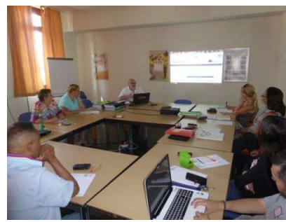
Réunion finale à Vienne