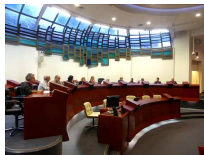
Présentation en plénière radio et handicap congrès du SNRL à Rennes